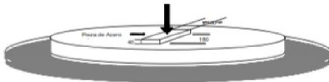
FIGURA 1 - Preparación de la muestra